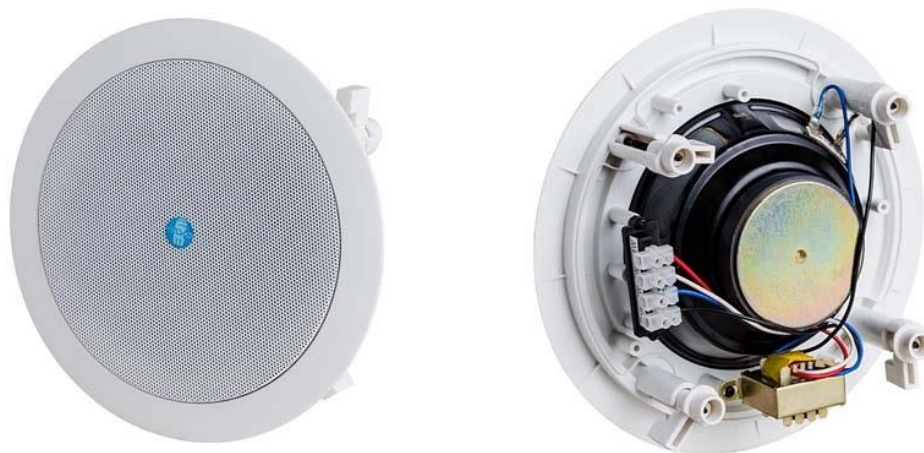
Рис. 1. Внешний вид громкоговорителя.

Внешний вид громкоговорителя показан на рис. 1.